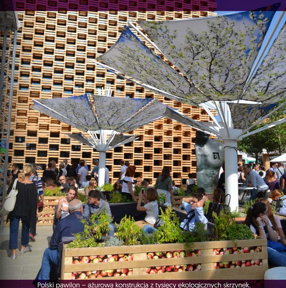
Polski pawilon – ażurowa konstrukcja z tysięcy ekologicznych skrzynek.

Każda z ekspozycji zawierała elementy zieleni obecne chociażby przed pawilonem – można było oglądać np. owocujące drzewa, miniplantacje warzyw, ciekawie pokazywaną plantację ryżu, uprawy papryki czy łąki kwietne.