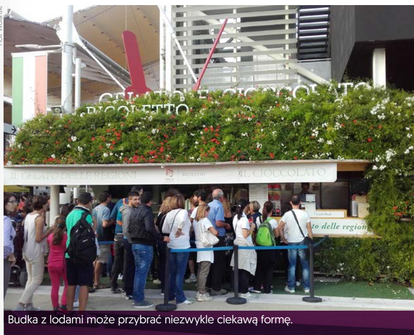
Budka z lodami może przybrać niezwykle ciekawą formę.